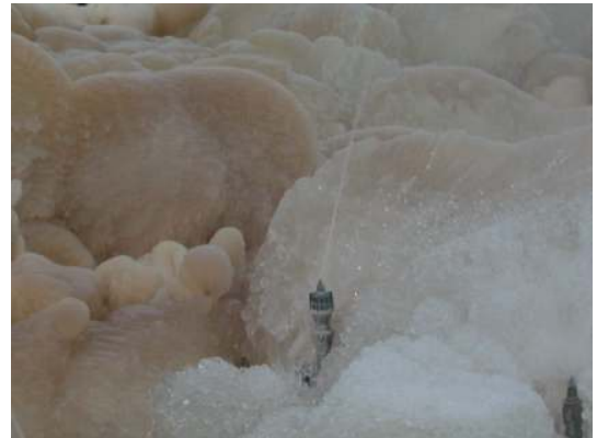
Figur 4 : Vinterdrift

Som vi ser av figur 4 tåler dysene lange perioder med kuldegrader uten at de fryser.