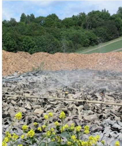
Figur 3 : Sommerdrift

Det er lagt opp en voll rundt kanten rundt bassenget hvor det er plantet Salix. Dette er gjort for å hindre avdrift av det forstøvede sigevannet når det blåser.