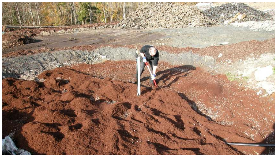
Figur 5 : Etablering av rensbassenger

Det er etablert to rensbassenger. Begge er sirkulære og har en diameter på ca 6 meter. Dybden i midten av hvert basseng er på ca. 1 meter. Vannet ledes inn i bassengene via et 32 mm PEL-rør som er festet til en stolpe og påkoblet en dyse i enden. Dysen står ca 1 m over bakken. I bunnen av bassenget under hver dyse er det plassert en oppsamlingspanne for prøvetaking av sigevannet. Det ene bassenget er fylt med en blanding av 2-4 leca og ABS-bark, det andre bare med ABS-bark.