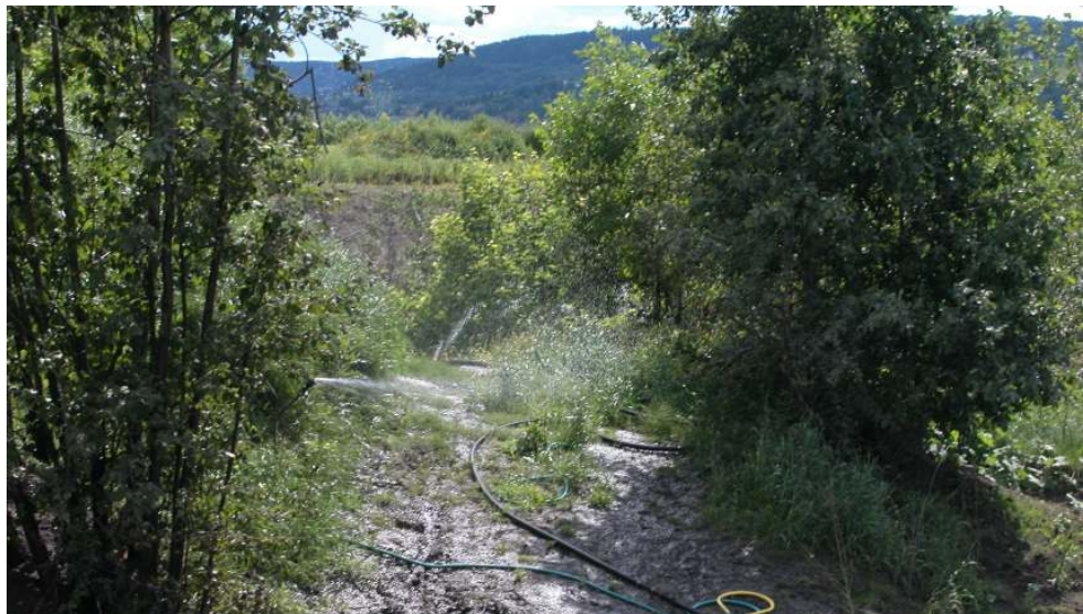
Figur 5 : Tidlig fase i etableringen av energiskog.

Energiskogen ble etablert i et allerede tilgrodd område av deponiet. Energiskogen vannes med forbehandlet sigevann via dyser som er festet på stolper i bakken. Det vannet som ikke fordamper eller tas opp av plantene går ned i deponiet og blir resirkulert på nytt.