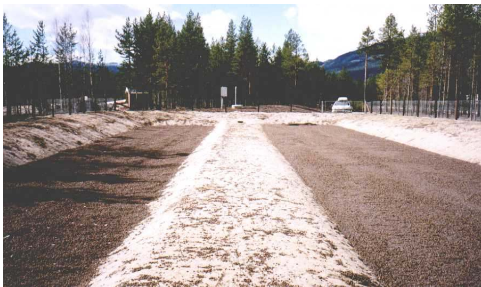
Figur 5: Infiltrasjonsanlegg med åpne bassenger på Atna

Ved bruk av lettklinker i åpne bassenger vil ca. 80 % av lettklinkeren flyte. Det flytende lettklinkerlaget er en svært effektiv luktsperre. Et infiltrasjonsanlegg med åpne bassenger med lettklinker på Atna er vist på figuren under.