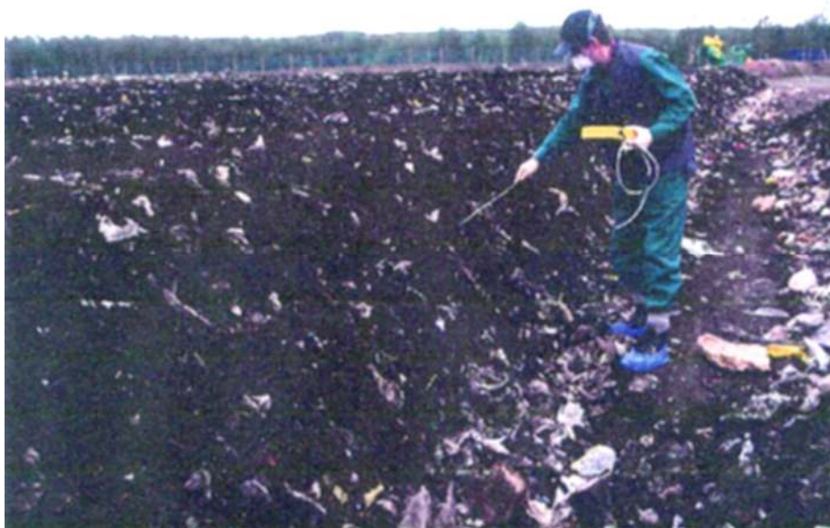
Figur 1: Onlinemålinger av lukt ved rankekompostering.

Måling av lukt i omgivelsene er vanskelig, og et mål på luktplagene i et område fås best ved en systematisk registrering av innkomne klager/tilbakemeldinger.