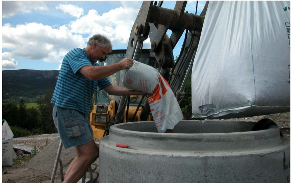
Figur 3: Bygging av luktrensetårn i Lier

Luktrensetårnet er bygget av vanlige kumringer i betong og fylt med en blanding av ABS-bark og 2-4 leca. Massen ble podet med luktdempende bakterier, gjødslet og vannet. Anlegget ble satt i drift sommeren 2003.