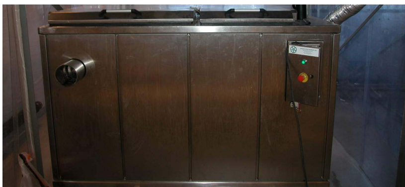
Figur 2: Komposteringsreaktoren på Bjørkelangen RA

I forbindelse med etablering av felles avløpsanlegg for hyttefelt etc. kan reaktorbehandling av slam være en aktuell metode. I samarbeid med Biosystemer Norge AS har Kolon-prosjektet testet en slik reaktor på Bjørkelangen RA i Aurskog-Høland kommune. Reaktoren er utviklet for kompostering av matavfall, men er også godt egnet for kompostering av slam som representerer en mer homogen masse enn matavfall.