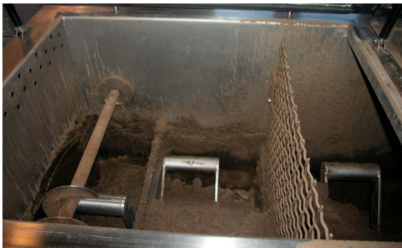
Figur 3: De tre kammerne med omrøringsarmer og skrue som mater ut ferdig kompostert materiale

Reaktoren har tre kammer med omrøringsarmer i hvert kammer. Kompostmassen mates fra det ene kammeret til det neste når ny masse tilsettes i reaktoren.