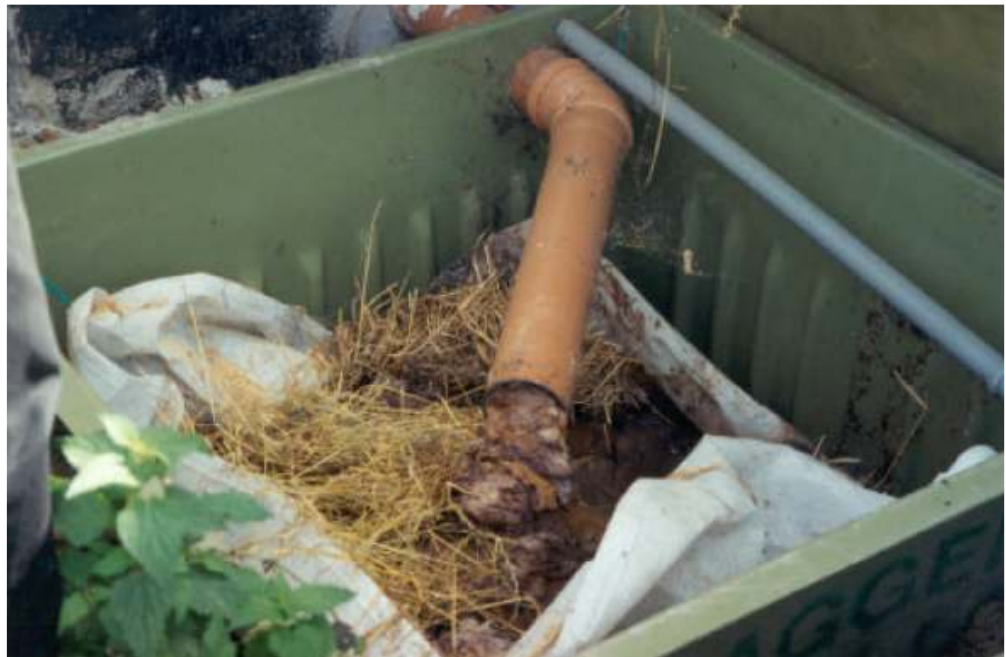
Figur 5: Utløpet fra avløpsrøret til oppsamlingsbeholderen i Kaggen

I testperioden ble huset der "Kaggen" var installert, bebodd av 4 voksne med meget høy hjemmefrekvens. I løpet av de første 13 månedene ble det samlet opp ca. 600 l avvannet materiale som så lå urørt i beholderen i ca ett år bortsett fra en enkelt tilsetning av en mindre mengde komposteringsmark. Etter ca ett år ble materialet flyttet over i "Hurtigkomposteren". Da var volumet redusert til ca 200 l. Etter ytterligere 10 måneder i "Hurtigkomposteren" var volumet nede i 75 liter. Den samlede volumreduksjonen var altså på hele 88 %.