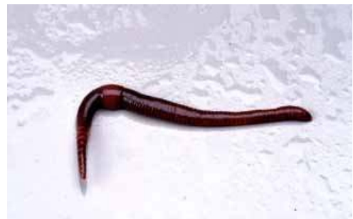
Figur 6: Komposteringsmark i Kaggen Figur 7 : Esenia Foetida

Arten Esenia Foetida kalles også for kompostmeitemark og er den arten som best nyttiggjør seg kompostmateriale. Lengden er fra 6 til 12 cm, den er purpurrød-rødbrun med lyse partier mellom segmentene.