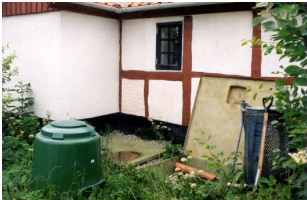
Figur 4: Kaggen og Hurtigkomposterer

Miljøstyrelsens "Aktionsplan for fremme av økologisk byfornyelse og spildevannsrensing" har støttet et prosjekt i Storstrøms amt der man bl.a. har testet ut et avløpssystem for enkelthus som heter "Kaggen". Prosjektet gikk over 3 år; fra 1998 til 2001. Anlegget er fremdeles i drift og ble besøkt på en studietur i januar 2004. Beskrivelse under er basert på rapport /4/.